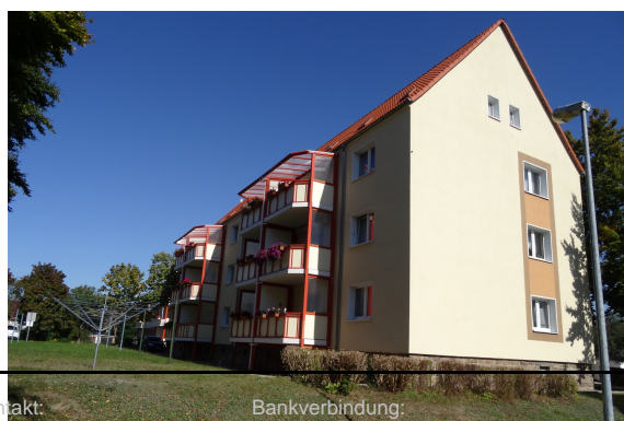
Kontakt: Tel.: 0 37 61 / 33 68 info@WGWerdaue.de www.WGWerdaue.de