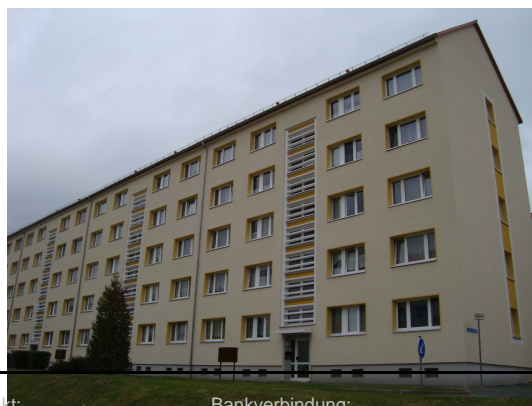
Kontakt: Tel.: 0 37 61 / 33 68 info@WGWerdau.de www.WGWerdau.de

Eingetragene Genossenschaft Registergericht Chemnitz GNR 17