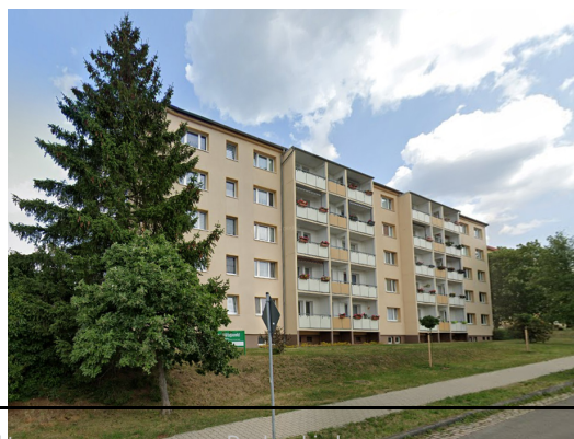
Kontakt: Tel.: 0 37 61 / 33 68 info@WGWerdau.de www.WGWerdau.de

Eingetragene Genossenschaft Registergericht Chemnitz GNR 17