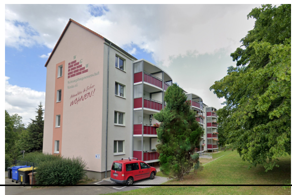
Kontakt: Tel.: 0 37 61 / 33 68 info@WGWerdau.de www.WGWerdau.de

Eingetragene Genossenschaft Registergericht Chemnitz GNR 17